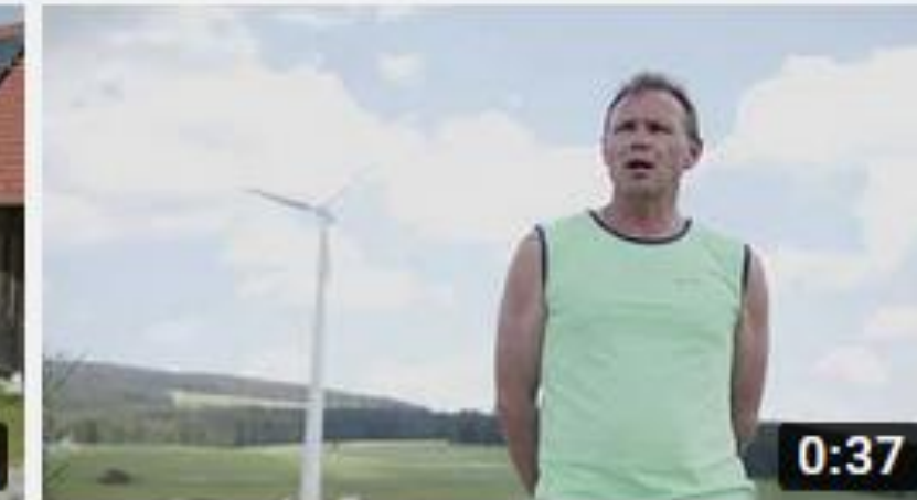
OurPower-Erzeuger Windpark Spörbichl